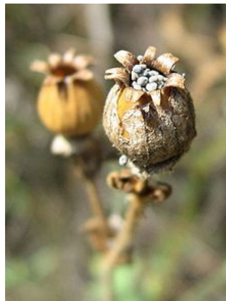
Fruto maduro con simientes