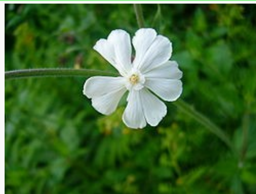
Silene alba , vista cenital