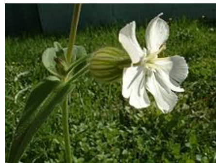
Cáliz y corola:detalle