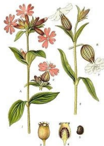
A. RÖDBLÄRA, MELANDRIUM DIOECUM LARSEN ET TH. B. VITBLÄRA, MELANDRIUM ALBUM GÄRCKE.